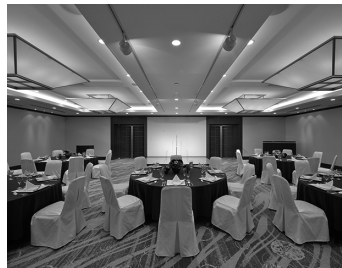
Banquet[ 宴会 ]

大切なひとときを、よりドラマティックに演出する京都東急ホテルのウエディング。お二人の気持ちがゲストに優しく伝わります。