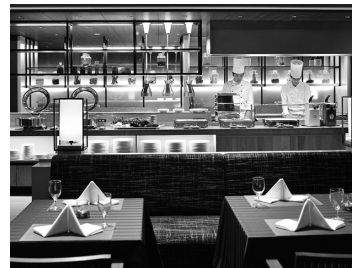
Restaurant[ 食事 ]

館内には大小8つの宴会場があり、レセプションや展示発表会、各種パーティーに幅広くご利用いただけます。多彩なメニュープランでお客様のご要望にお応えします。