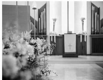
Wedding[ 婚礼 ]

和のデザインアートを取り入れた、「菓和いい-Kawaii-」がテーマの上質空間、快適なスペースと機能性を一新したアップグレードフロア「コンセプトフロア」。